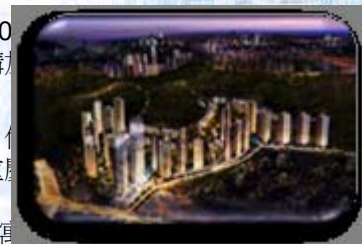
圖：重慶鴻恩國際生活社區

重慶鴻恩國際生活社區為公司進入重慶的首個項目，位於全城最大中央森林公園——鴻恩寺公園內，地處重慶主城核心江北區鴻恩寺地塊，該板塊緊鄰江北嘴CBD。項目總規劃建築面積98萬平方米，由洲際公寓和都心花園洋房組成。