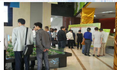
圖: 西安首創國際城二期開盤

鑒於計算銷售資料時存在不確定因素，故上述銷售資料與定期報告中披露的資料或存在偏差。因此，投資者應視本通訊披露之資料作參考之用。