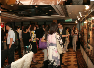
圖:禧瑞都和緣禧堂 項目香港推介現場