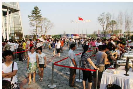
圖:西安首創國際城「開啟幸福之旅」活動現場