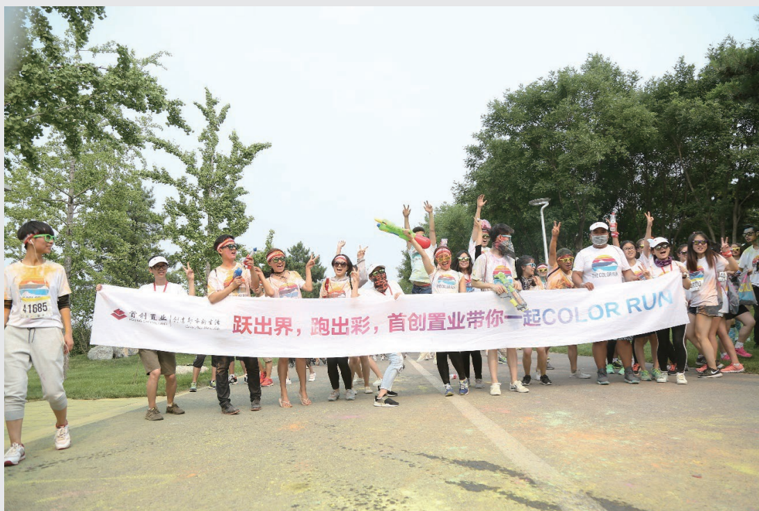
首創置業繼續支持The Color Run活動

2017年，首創置業繼續支持了The Color Run活動。The Color Run一直強調「健康、快樂、大眾參與」的跑步理念以及「自由、健康、快樂」的生活理念，這與首創置業5C戰略倡導的運動健康生活理念不謀而合。2017年，首創置業與The Color Run合作舉辦了北京、上海、重慶、深圳、成都五站活動。