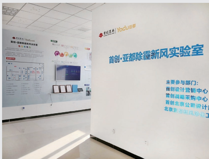
首創—亞都除霾新風實驗室

此外，本公司亦注重從項目的實際情況出發，因地制宜，通過採取針對性的解決措施，改善空氣質量。