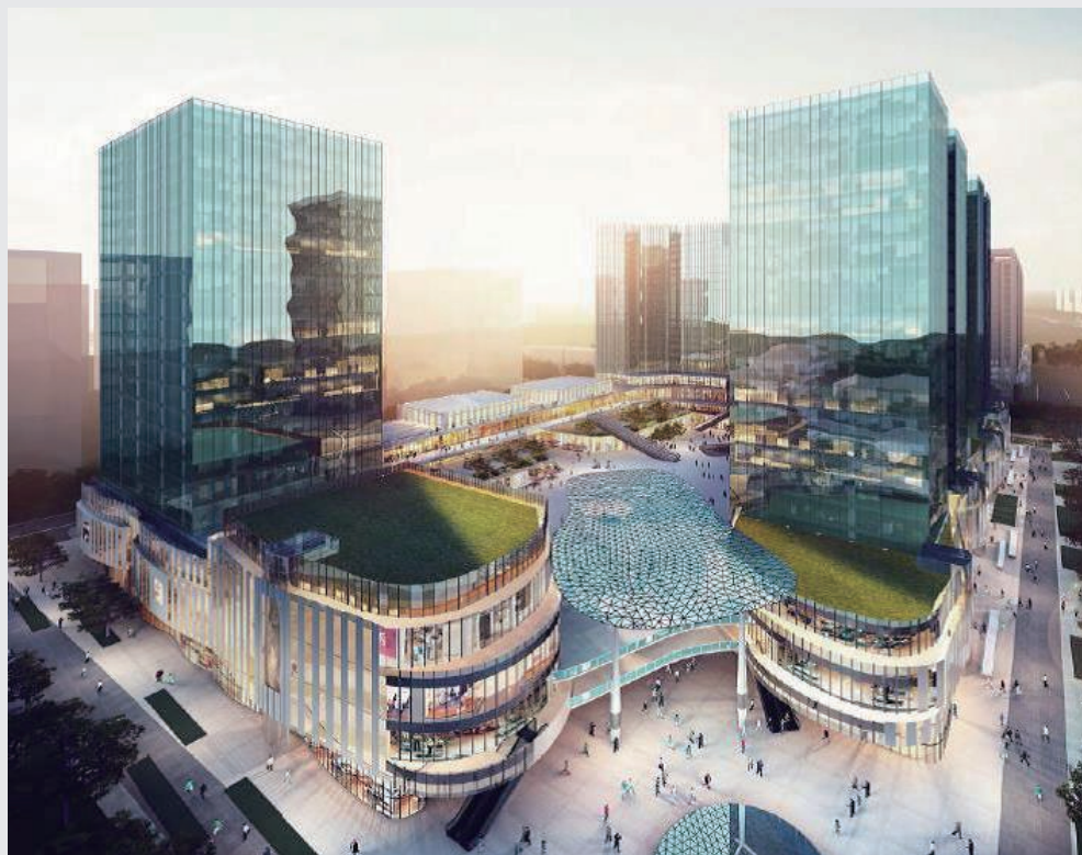
光合中心效果圖，北京大興

以籌建中的光合中心項目為例，其能源規劃採用了深層地熱+冰蓄冷的組合能源形式。項目中採用的中深層地熱能是指地表下2,000米以下蘊藏的中高位熱能。地熱能主要來自地球內部長壽命放射性同位素熱核反應產生的能量。該能源形式能有效減少項目的碳排放，有利於可持續發展以及項目周圍環境的改善，相比傳統能源節能達40%以上。